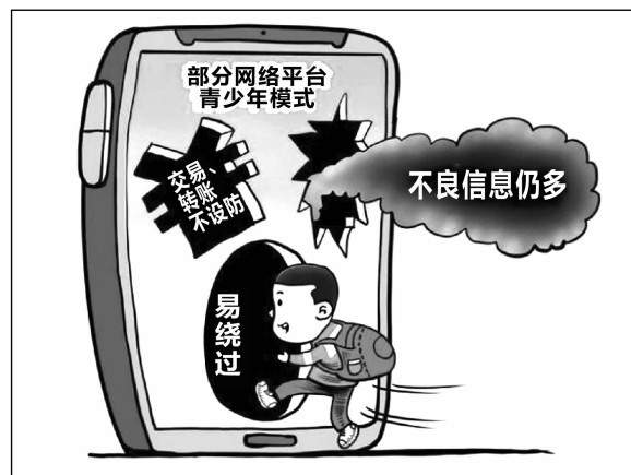
新华社发 朱慧卿 作