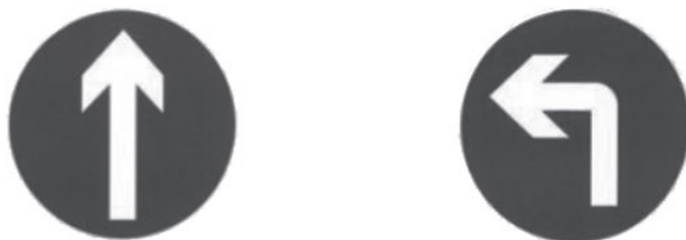
图 1-6 蓝色交通安全标志

蓝色交通安全标志表示指令，多用于传递指示信息，要求人们必须遵守的指示、指令，如图 1-6 所示。