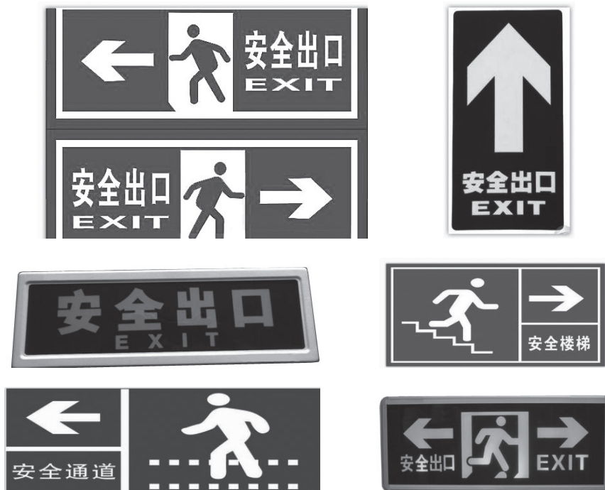
图 1-3 逃生疏散指示标志