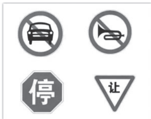
图 1-5 圆形、八角形、顶角向下的等边三角形的红色交通安全标志

蓝色交通安全标志表示指令，多用于传递指示信息，要求人们必须遵守的指示、指令，如图 1-6 所示。