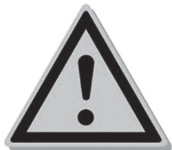
图 1-7 黄色交通安全标志