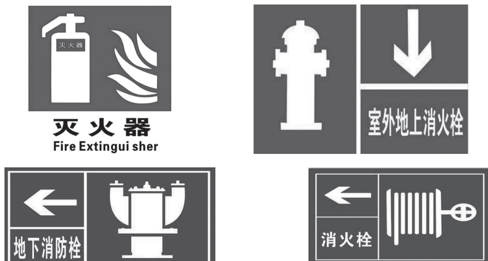
图 1-4 常见灭火设备标志