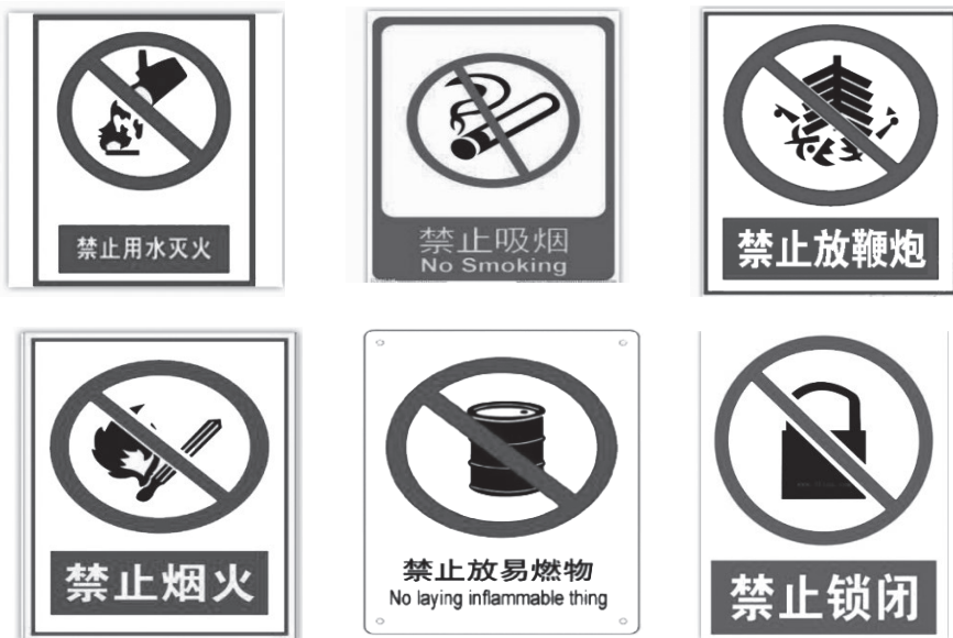
图 1-2 有火灾或爆炸危险的物质或场所的标志