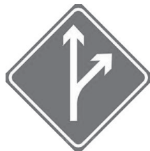
图 1-8 绿色交通安全标志