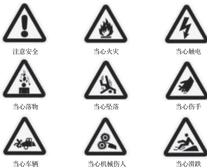
图 1-1 常见的安全标志