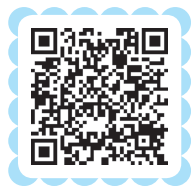
视频 婴幼儿活动照护