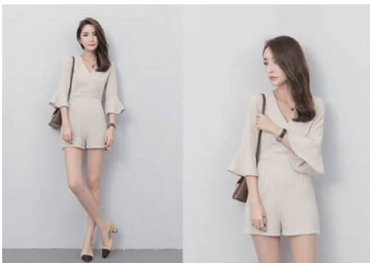
图 1-4 随意职场着装