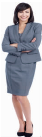
图 1-1 保守职场女士着装