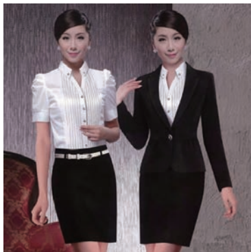
图 1-3 创意职场着装

②随意职场人士。随意职场人士在自我形象的把握中拥有回旋余地最大、变通方式最多的优势。他们的工作性质使其不需要在着装上过多考虑,几乎可以跟着感觉走。但是也不能忽略形象所具有的自我暗示的心理作用,即使自己的职业性质决定了自己不需要在社会中过多地出现、与他人进行交流,但舒服、得体的着装也可以让自己得到满足和享受。在现实社会中,“男、女为己容”早已是人们一致认同的新理念。