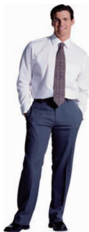
图 1-2 保守职场男士着装