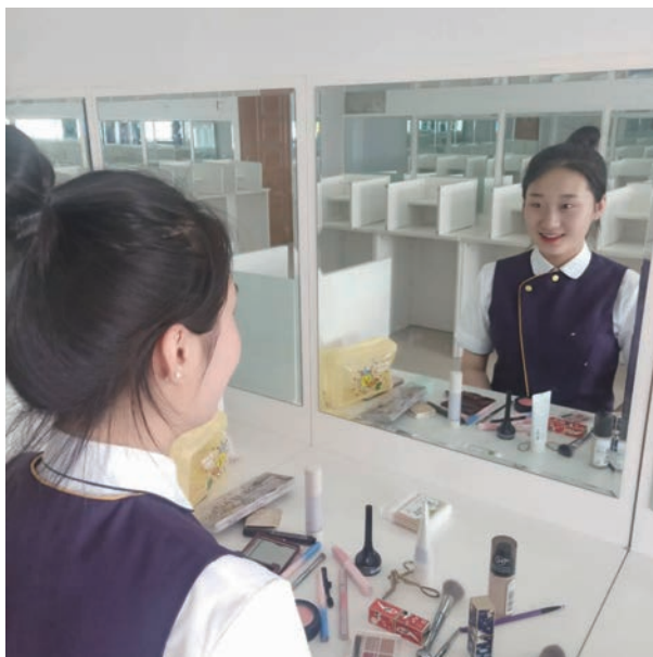
图 1-4 涂抹粉底