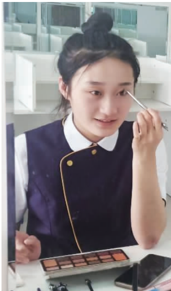
图 1-6 眼线的勾画

b. 眼线要根据眼型勾画(见图 1-6),线条要流畅自然,注意虚实结合。睫毛浓密、眼型条件好的人可不画眼线,只需强调睫毛的漂亮曲线和浓度;睫毛、眼型条件一般者可选用黑色或棕黑色眼线笔或眼线墨(膏)勾画眼线,画完要用笔或眼线刷把它揉开,尽量使其显得自然。