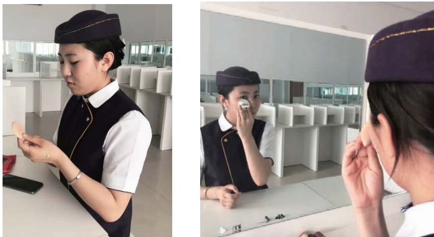
图 1-9 裸妆上底妆

(2)眉的修饰。描画眉毛的重点是让眉头处尽可能保持原有的形状,看起来自然为佳,眉锋处色彩最深,眉尾处转淡,眉色的深浅变化能增加眉毛的立体感。