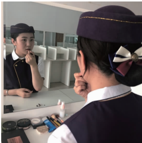
图 1-10 裸妆唇的修饰

(4)唇的修饰。选择与唇膏或唇彩颜色相近的唇笔,画出自己喜欢的唇型,再用唇刷蘸上颜色,涂满双唇,如图 1-10 所示。