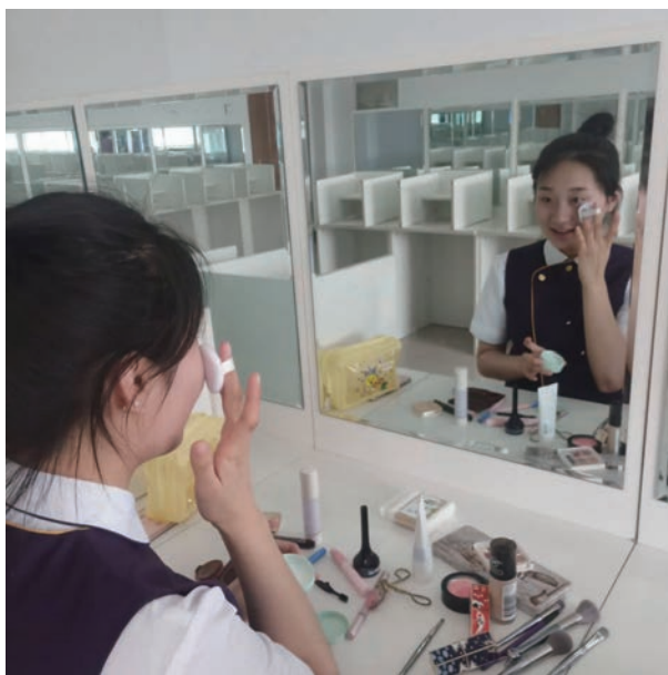
图 1-5 定 妆