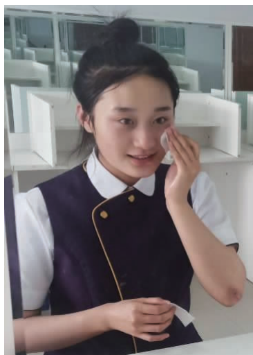
图 1-2 清洁皮肤

①清洁皮肤(见图 1-2)。为了能更好地上妆,同时使妆面的保持时间更长久,化妆之前应做好洁肤工作,使用适合自身皮肤的清洁产品进行皮肤清洁。