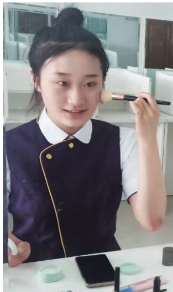
图 1-7 面颊的修饰

⑥面颊的修饰(见图 1-7)。修饰面颊主要是用腮红晕染,所用腮红要浅淡、柔和。如果肤色健康、着装素雅,可免去这一步骤。