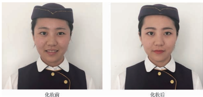
图 1-1 化妆前后对比