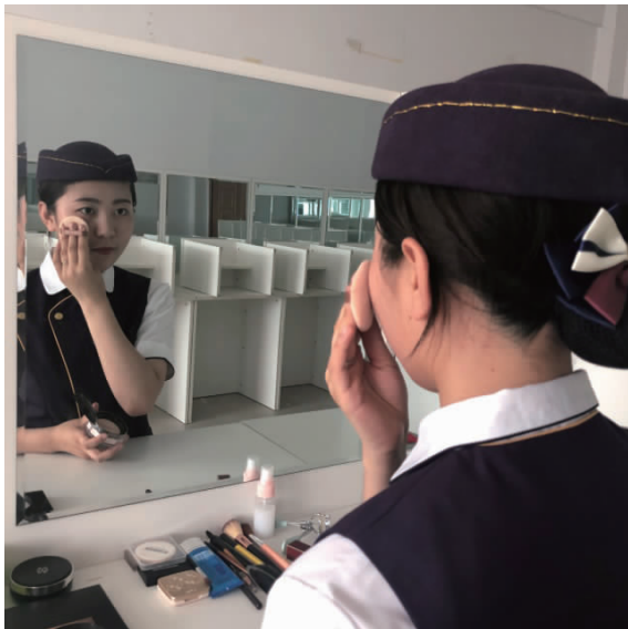
图 1-11 裸妆定妆

(5)定妆。用粉扑将蜜粉以点按的方式扑在面部,切忌用粉扑在妆面上来回抹,这样会破坏粉底。防止粉底脱妆的关键在于鼻部、唇部及眼部周围,这些部位要小心定妆。最后用掸粉刷将多余的散粉扫去,动作要轻,以免破坏妆面,如图 1-11 所示。