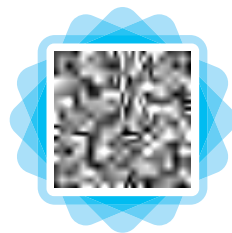
视频：我们都是国家安全的守护人

党的二十大报告指出：“国家安全是民族复兴的根基，社会稳定是国家强盛的前提。必须坚定不移贯彻总体国家安全观，把维护国家安全贯穿党和国家工作各方面全过程，确保国家安全和社会稳定。”