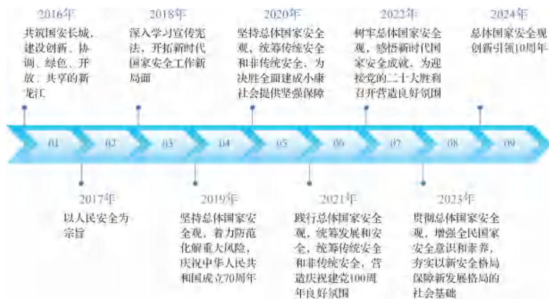
图 1-1 历年国家安全教育日主题