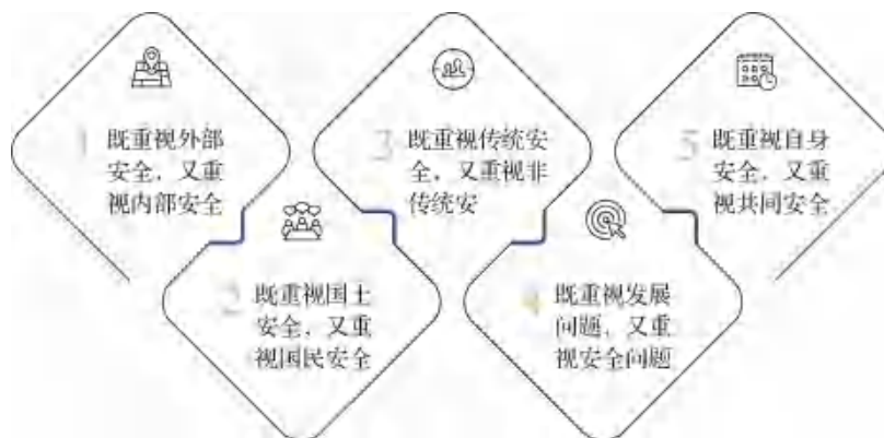
图 1-3 总体国家安全观要求兼顾的五对关系

贯彻落实总体国家安全观，要超越只重国土安全的传统安全观和传统安全治理模式，坚持以民为本、以人为本，坚持国家安全一切为了人民、一切依靠人民，真正夯实国家安全的群众基础。近年来，党和国家不断加强对国民海外利益的保护：针对恐怖分子、海盗、敌对势力的滋扰破坏，国家果断派出专业力量、护航编队打防并举；当发生重大事件时，国家有力地协调各方组织跨国缉凶、海外撤侨。越来越多的中国人走出国门的同时，国家的保护同步延伸。